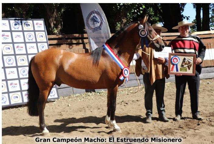
Gran Campeón Macho: El Estruendo Misionero

litó el día viernes de su rodeo, que es sábado y domingo, y nos ayudó a poder hacer nuestra exposición acá. Queríamos hacer algo en esta comuna, así que estamos muy contentos". "Hubo bonitos caballos, eran