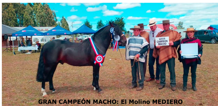
GRAN CAMPEÓN MACHO: El Molino MEDIERO