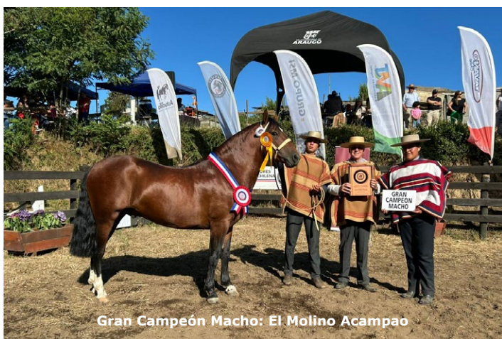
Gran Campeón Macho: El Molino Acampao

"Estuve viendo la evaluación que hizo nuestro jurado y fue de muy buen porcentaje, así que la calidad de los productos fue muy alta. Incluso, en la categoría machos, le costó mucho trabajo para decidir el gran campeón y también en la categoría hembra, pero los pequeños detalles hacen la diferencia entre un producto y otro", agregó.