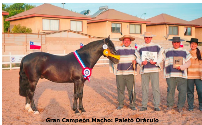
Gran Campeón Macho: Paletó Oráculo