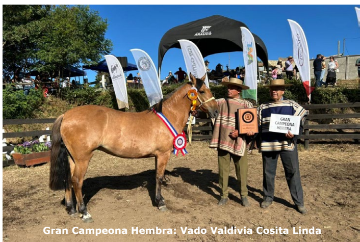
Gran Campeona Hembra: Vado Valdivia Cosita Linda