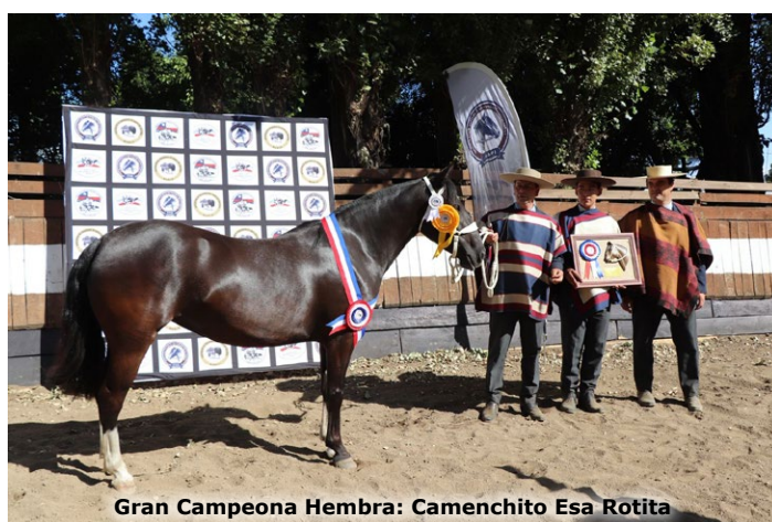
Gran Campeona Hembra: Camenchito Esa Rotita