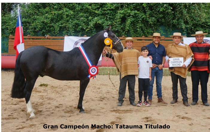
Gran Campeón Macho: Tatauma Titulado

Sobre los Grandes Campeones, el jurado comentó que "me voy muy conforme, el macho es un potro muy equilibrado, de mu-