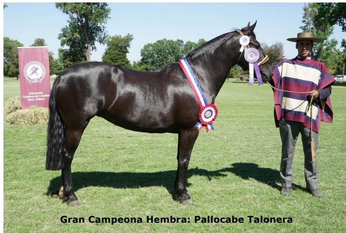
Gran Campeona Hembra: Pallocabe Talonera