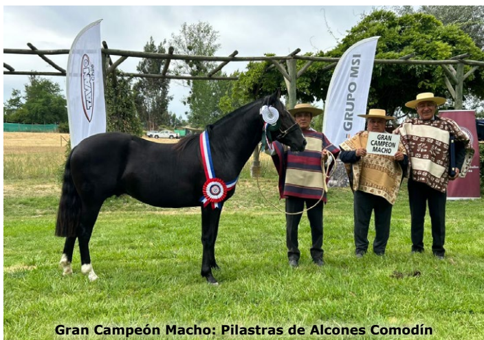
Gran Campeón Macho: Pilastras de Alcones Comodín

"Tuvimos algo menos de ejemplares, tuvimos 40 en pista, generalmente tenemos más de 50 en San Fernando, pero 40 es un buen número y hubo muy buenos productos, así que estamos muy contentos", cerró.