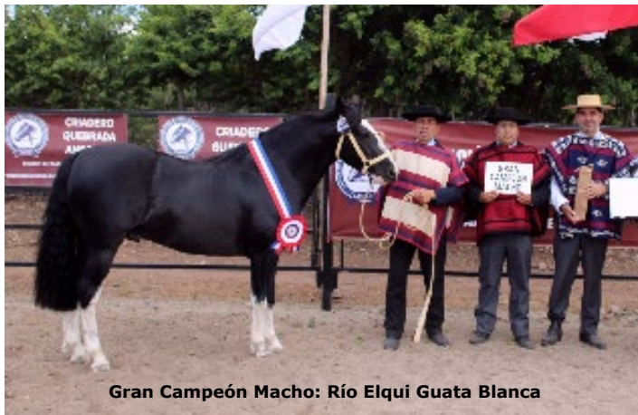
Gran Campeón Macho: Río Elqui Guata Blanca

En cuanto a los Grandes Premios, comentó que "tanto los potrillos y los ya en más desarrollo, todos tienen un sello racial muy característico, muy bueno. Tanto en el sello racial y ya obviamente los mayores con muy buenos desarrollos y la envergadura, tanto esquelética como muscular".