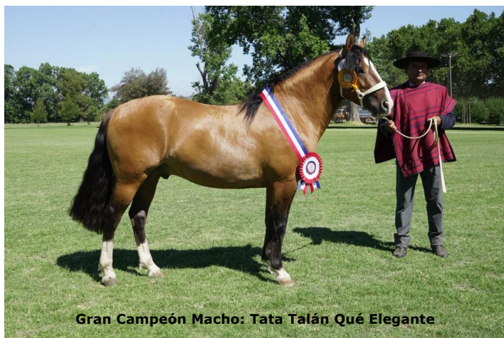
Gran Campeón Macho: Tata Talán Qué Elegante

"Agradezco también a todos los socios que nos cooperaron, que siempre nos están ayudando y dispuestos a lo que nosotros como directorio les pidamos para que el evento salga de