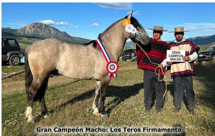
Gran Campeón Macho: Los Teros Firmamento