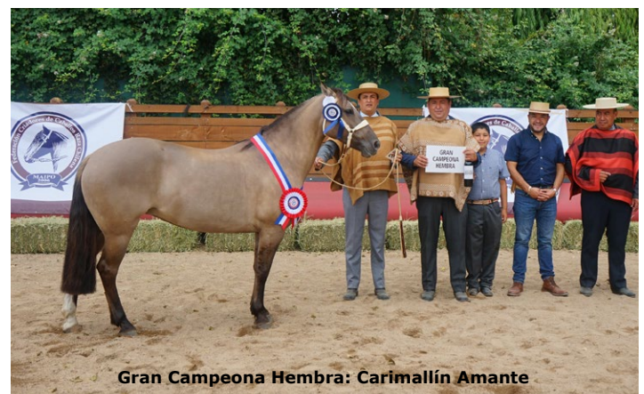
Gran Campeona Hembra: Carimallín Amante