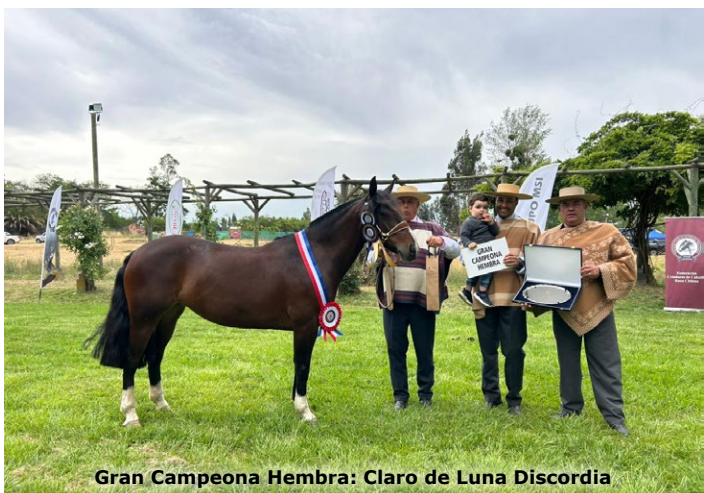
Gran Campeona Hembra: Claro de Luna Discordia