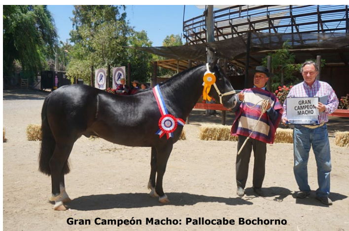
Gran Campeón Macho: Pallocabe Bochorno