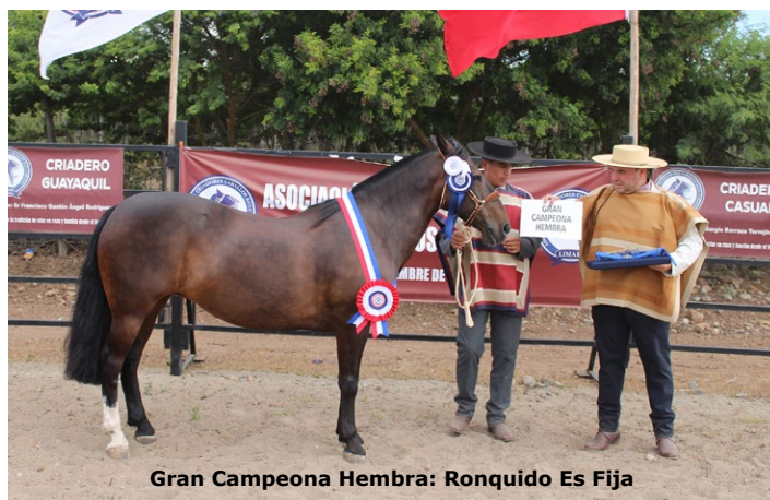
Gran Campeona Hembra: Ronquido Es Fija