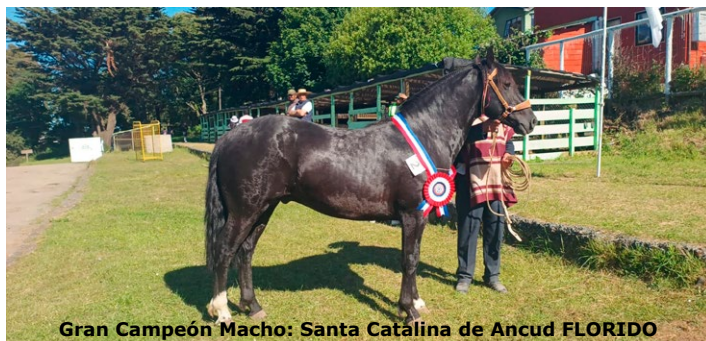
Gran Campeón Macho: Santa Catalina de Ancud FLORIDO

En la definición por el Gran Campeón Macho, dijo: "Tuvi-mos que pedir la presencia del Campeón Potrillo porque no hubo Campeón Potro Mayor. Finalmente, el potrillo lo en-