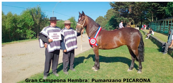
Gran Campeona Hembra: Pumanzano PICARONA